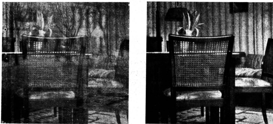
Fig. II Fotografia tirada sem filtro A mesma obtida com filtro Bernotar (Duma notícia Zeiss)

A introdução da herapatita nos vidros dos parabrisas e janelas dos vagões trarão vantagens semelhantes.