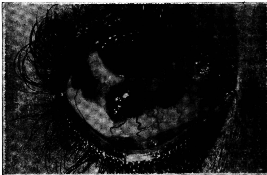
Fig. 1 — Fotografia Clínica OD — Papilomas são observados nas vizinhanças do bordo palpebral superior, fundo de saco inferior e próximo ao limbo esclero-corneano.

Diagnóstico clínico: papilomas múltiplos das conjuntivas palpebral e bulbar.