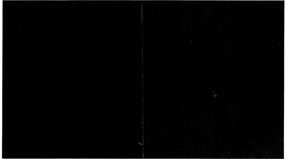
Figura 1. Caso 1, fotografia mostrando papiledema bilateral severo.

Caso 8- Paciente de 64 anos, sexo feminino, branca, notou súbita falha no campo superior do O.E.. A A.V. era 20/20 em A.O. e o C.V. mostrou defeito altitudinal superior no O.E.. Permaneceu inalterada até que uma semana de-