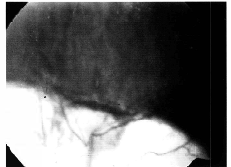
Fig. 3 - E. L. M. (caso 3) O. E.: Retinografia mostrando coloboma de coróide englobando parte do nervo óptico e mácula, com linha de pigmentação na margem do coloboma.

Os agentes teratogênicos mais prováveis de causar malformações oculares são: irradiação recebida pela mãe entre a 4 a e 11 a semanas da gestação;