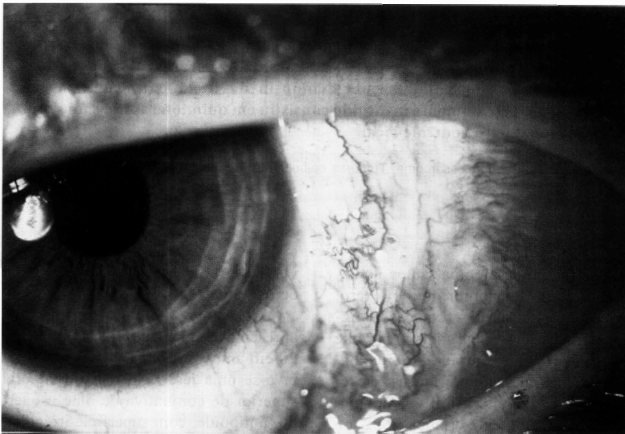
Fig.1 - Exame biomicroscópico apresenta tumoração em região subconjuntival de olho esquerdo.

As características clínicas e histopatológicas de rabdomiossarcoma botríide de órbita são idênticas ao sarcoma botríide, um tumor do trato genitourinário de crianças do sexo feminino 2 . É importante diferenciar de outros tumores que podem imitar micros-