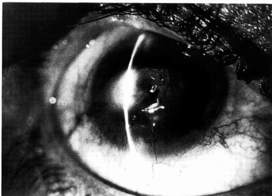
Fig.1: Caso 1: Ceratite geográfica (3x6mm) com necrose do tecido adjacente. Note hemorragia intra-corneal ao redor da ceratite.

Caso 2: Paciente de 58 anos, feminino, foi também referida para tratamento de neovascularização da córnea devido à prévia doença corneal herpética no olho direito há 7 meses. Acuidade visual era conta-dedos e à lâmpada de fenda apresentava opacidade corneal intensamente vascularizada com grande vaso ínfero-nasal. Os parâmetros do laser foram os seguintes: 250 mJ de energia, 50-100 micrômetros de diâmetro, 0,20 ms de exposição e um total de 200 disparos no vaso alimentador da NC. Prescrevemos anti-inflamatório não hormonal tópico 4 vezes/dia. Não prescrevemos Aciclovir no pós-operatório imediato. Após 3 dias, paciente retornou com quadro de olho vermelho doloroso e sensação de corpo estranho. À lâmpada de fenda, paciente apresentava ceratite dendrítica central com moderada uveíte. Prescrevemos Aciclovir sistêmico 2g/dia (dividido em 5 doses de 400mg). A ceratite não melhorou após