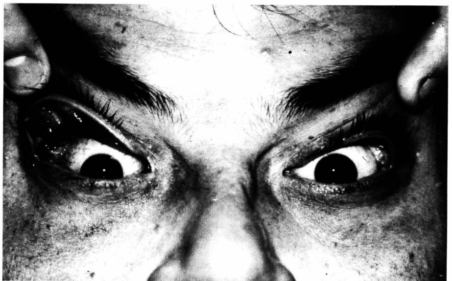
Foto 2 - Paciente 2 apresentando o sinal da eversão palpebral à direita.