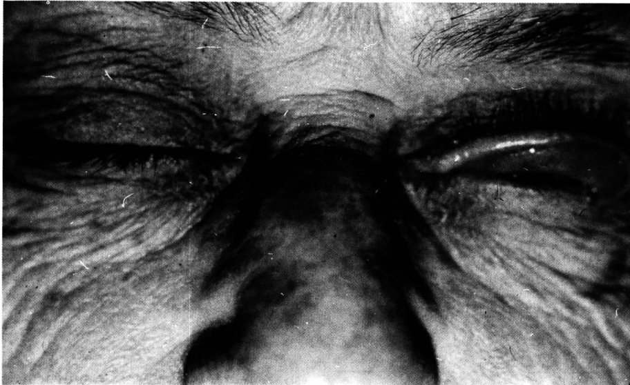
Foto 1 - Paciente 1 com eversão espontânea da pálpebra superior esquerda.

lar em OD há dois anos; neste período também apresentou meibomite bilateral que foi tratada sem sucesso. Havia piora dos sintomas pela manhã com eventual embaçamento da visão. Costumava dormir de bruços sobre o lado direito.