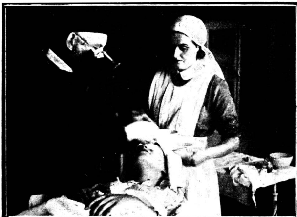
Prof. Weve com avental preto, durante uma operação.

se elevaram a 86% dos casos em 1937, esperando-se para 1938 uma percentagem mais elevada. Tivemos a oportunidade de assistir a 2 operações