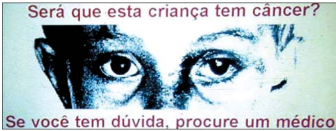
Figura 4 - Outdoor veiculado em campanha nacional de 1986 alertando pediatras e população em geral quanto à importância do diagnóstico precoce nos retinoblastomas