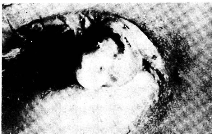
FIG. 1 — Fotografia clínica — Tumoração pediculada ao nível do terço interno da pálpebra superior direita. Observe-se a secreção muco-purulenta presente na superfície da lesão.

O exame externo revelou a presença de tumoração ao nível do terço interno da pálpebra superior direita (FIG. 1) de coloração róseo-avermelha.