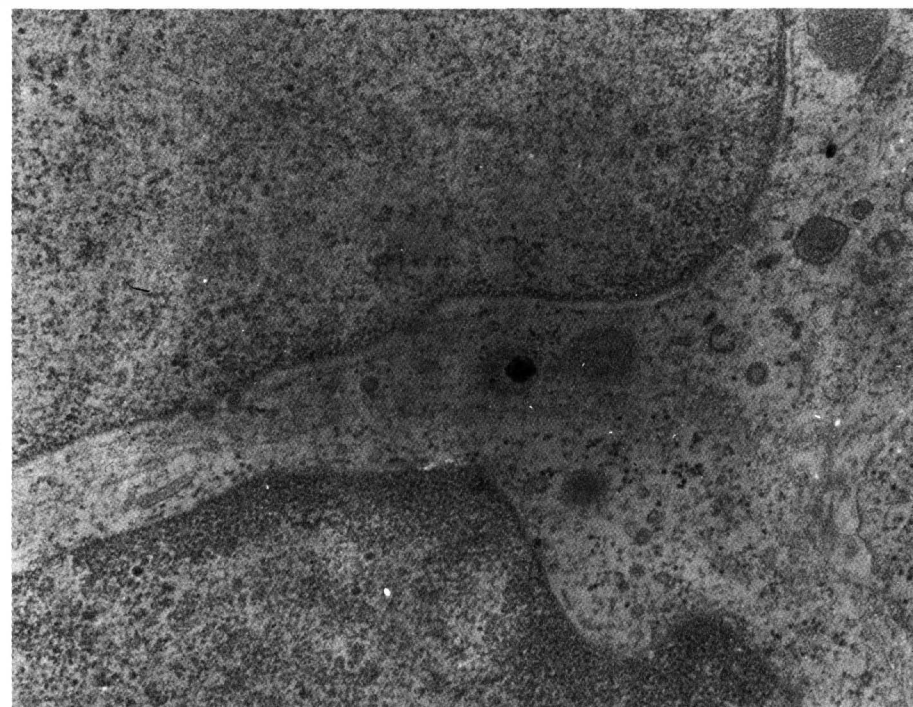
Foto 2 – Célula retiniana degenerada com inclusão viral herpética ( x 20.000)