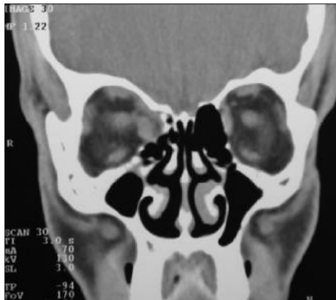
Figura 1 - Tomografia computadorizada, corte coronal, mostrando à direita parede orbitária inferior íntegra e fratura de parede medial, com deslocamento do músculo reto medial para dentro do seio etmoidal

O paciente foi submetido a cirurgia para correção da fratura orbitária. Após cantólise lateral e eversão da pálpebra inferior, foi feita incisão da conjuntiva do fórnice inferior e conse-