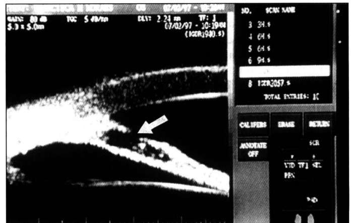
Fig. 3 - Biomicroscopia ultra-sônica (UBM) mostrando ângulo irido-corneano fechado em paciente com Síndrome de Chandler (Caso 1). A seta mostra atrofia setorial da íris.